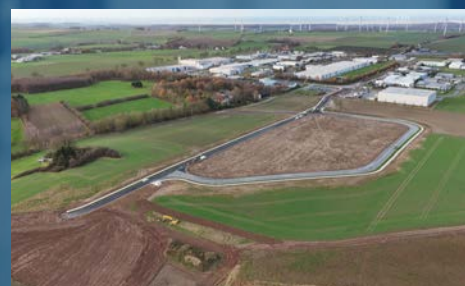
Ansicht Richtung Westen