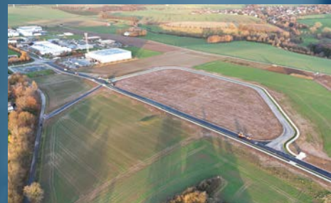
Ansicht Richtung Osten